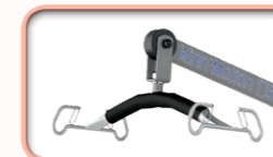
Fléau 4 points sécurisés