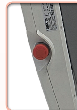
Bouton arrêt d'urgence