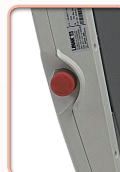
Bouton arrêt d'urgence