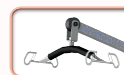
Fléau 4 points sécurisés